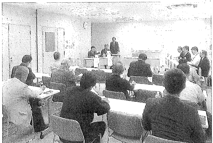
問題解決に向けて団結